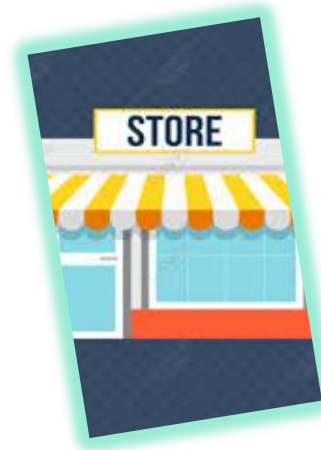
AKTIVITAS PASAR/ PUSAT PERTOKOAN