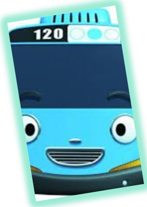
ANGKUTAN UMUM ORANG DAN BARANG