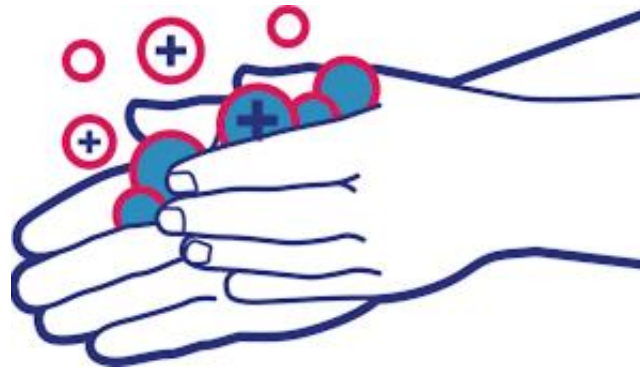
CUCI TANGAN PAKAI SABUN DENGAN AIR MENGALIR