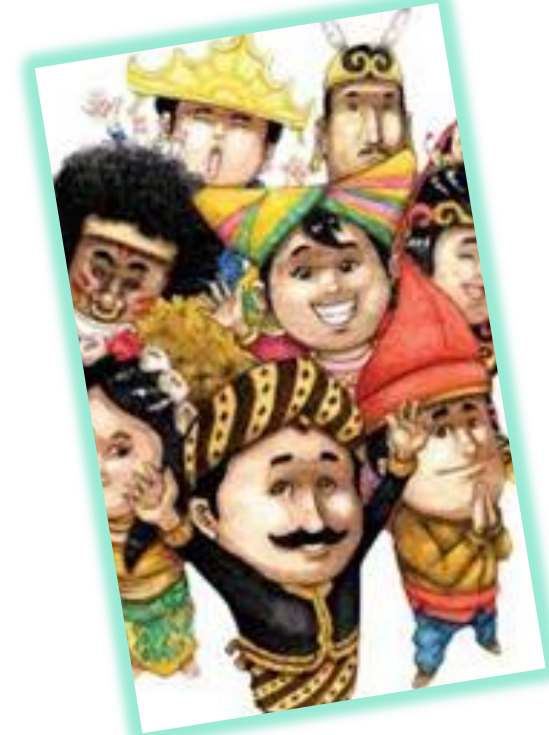
AKTIVITAS SOSIAL BUDAYA

SETIAP SEKTOR MELAKUKAN SOSIALISASI PROTOKOL KESEHATAN MELALUI BALIHO, SPANDUK, STIKER DAN MEDIA LAIN SECARA MASSIVE