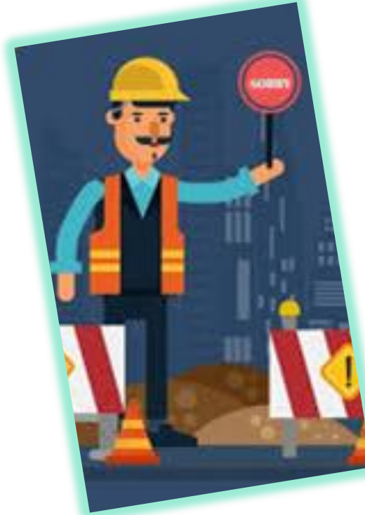
AKTIVITAS PEKERJAAN KONSTRUKSI