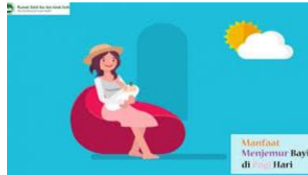
MENDAPATKAN SINAR MATAHARI YANG CUKUP