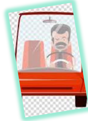
PENGGUNA MOBIL PRIBADI