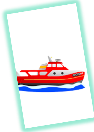
ANGKUTAN SUNGAI, DANAU DAN PENYEBERANGAN