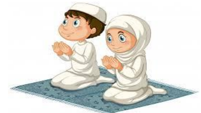
PERBANYAK IBADAH DAN DOA