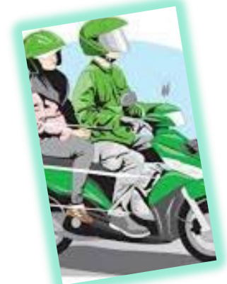
PENGGUNA SEPEDA MOTOR