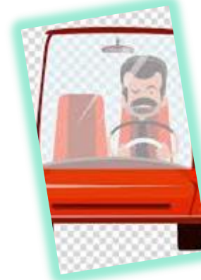
PENGGUNA MOBIL PRIBADI