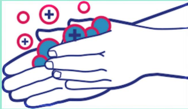
CUCI TANGAN PAKAI SABUN DENGAN AIR MENGALIR