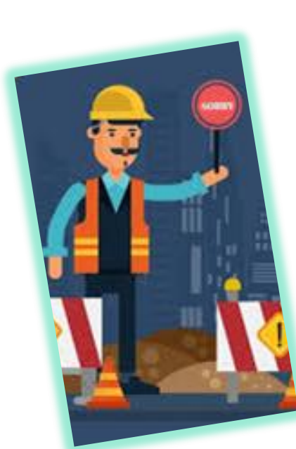
AKTIVITAS PEKERJAAN KONSTRUKSI