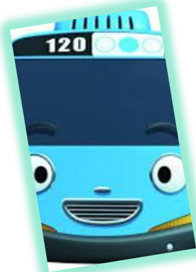
ANGKUTAN UMUM ORANG DAN BARANG