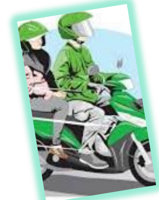
PENGGUNA SEPEDA MOTOR