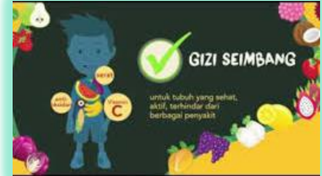
MENKONSUMSI GIZI YANG SEIMBANG