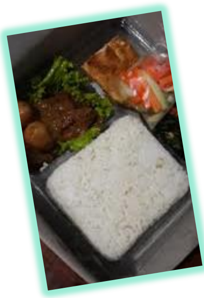
AKTIVITAS RUMAH MAKAN, KULINER