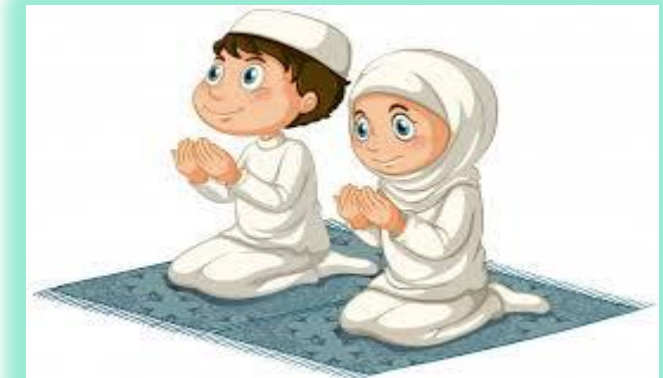
PERBANYAK IBADAH DAN DOA