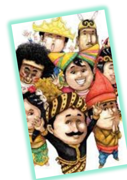
AKTIVITAS SOSIAL BUDAYA