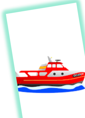
ANGKUTAN SUNGAI, DANAU DAN PENYEBERANGAN