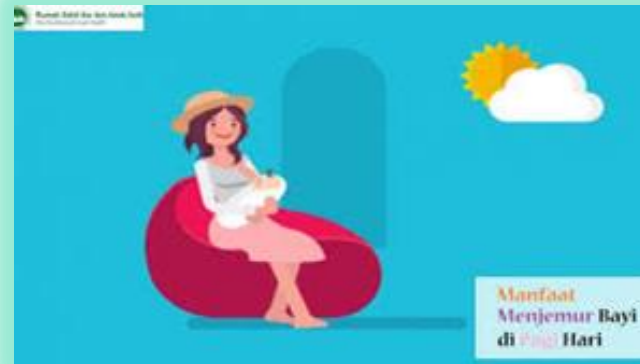
MENDAPATKAN SINAR MATAHARI YANG CUKUP