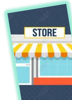
AKTIVITAS PASAR/ PUSAT PERTOKOAN