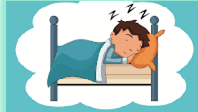
ISTIRAHAT YANG CUKUP