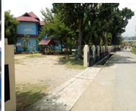
PROSES PEMBELAJARAN MENGOPTIMALKAN PEMBELAJARAN JARAK JAUH/DARING