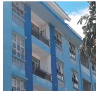
PROTOKOL KESEHATAN UNTUK SISWA SELAMA DI SEKOLAH