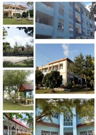
PROTOKOL BERANGKAT DARI RUMAH MENUJU SEKOLAH