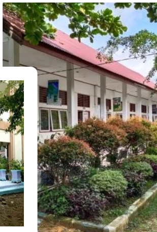
PROTOKOL KESEHATAN SARANA DAN PRASARANA SEKOLAH