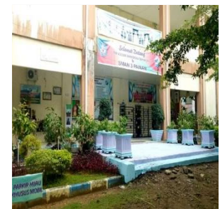
PROTOKOL KESEHATAN UMUM SEKOLAH