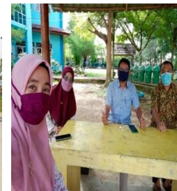
PROTOKOL KESEHATAN UNTUK GURU DAN TENAGA KEPENDIDIKAN SELAMA DI SEKOLAH