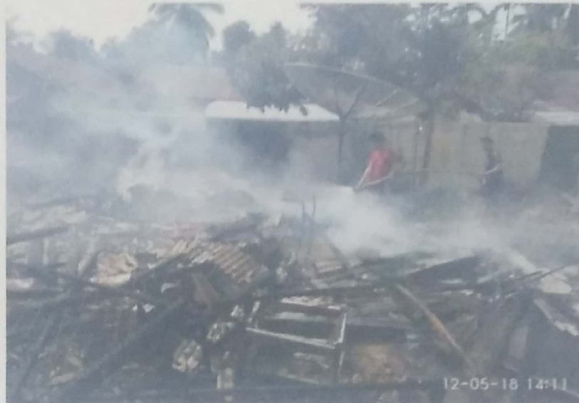
DOKUMENTASI KEBAKARAN RUMAH