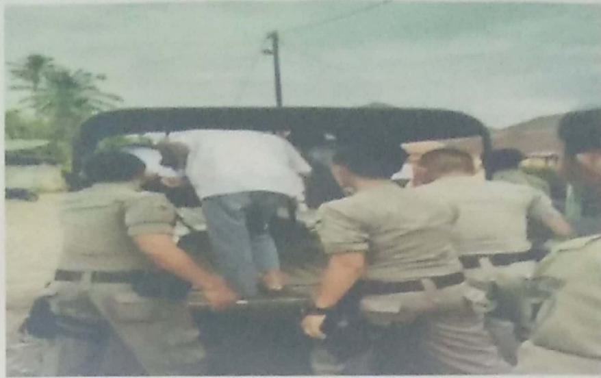
ANAK SEKOLAH BOLOS WAKTU JAM BELAJAR