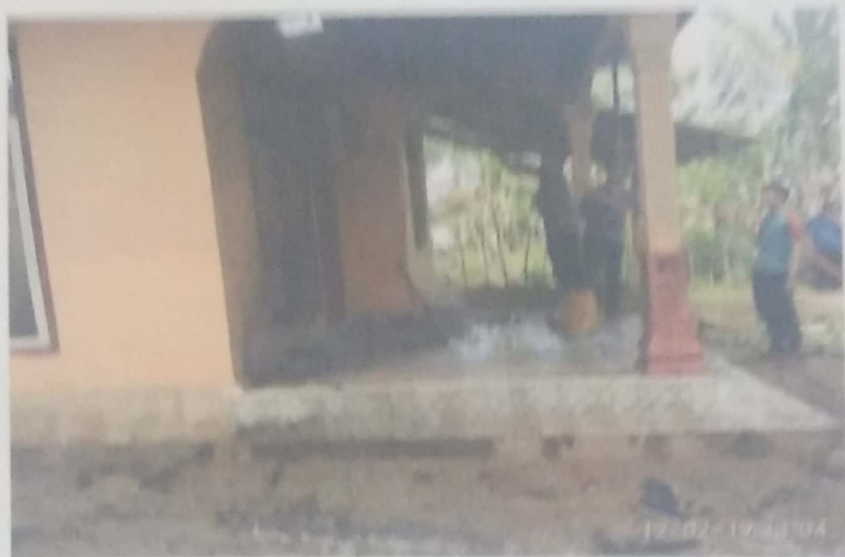
DOKUMENTASI KEBAKARAN RUMAH