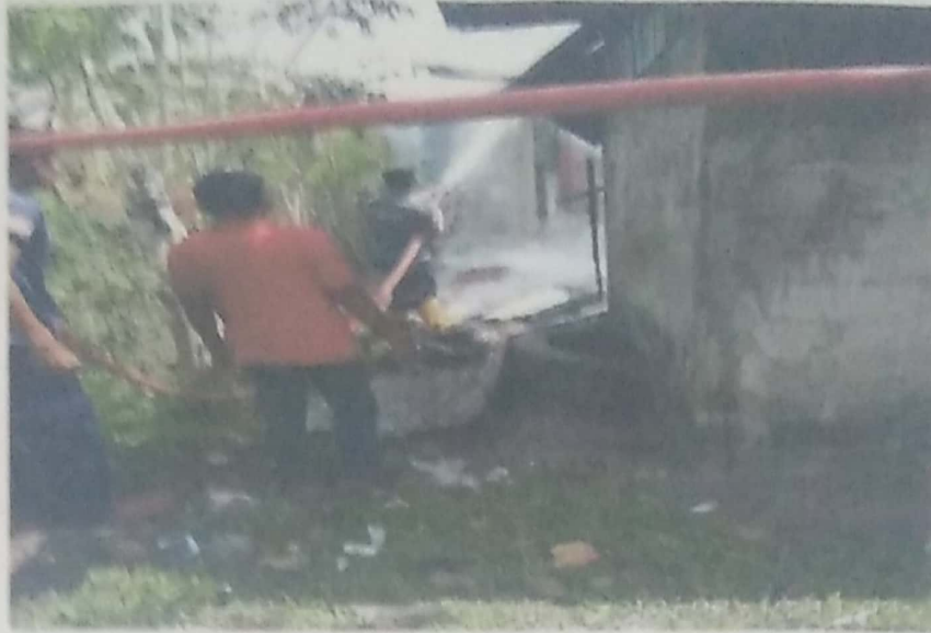
DOKUMENTASI KEBAKARAN RUMAH