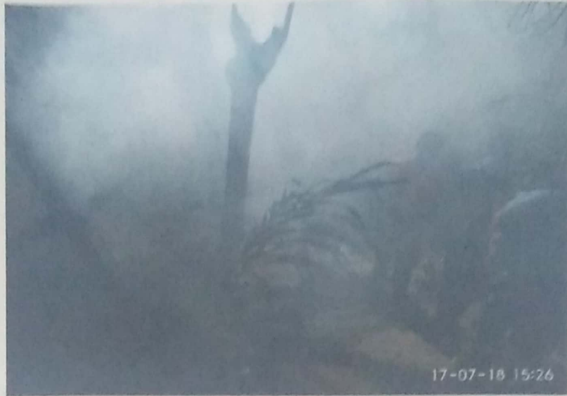
DOKUMENTASI KEBAKARAN LAHAN