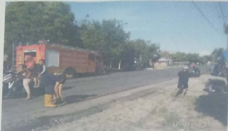
DOKUMENTASI KEBAKARAN RUMAH