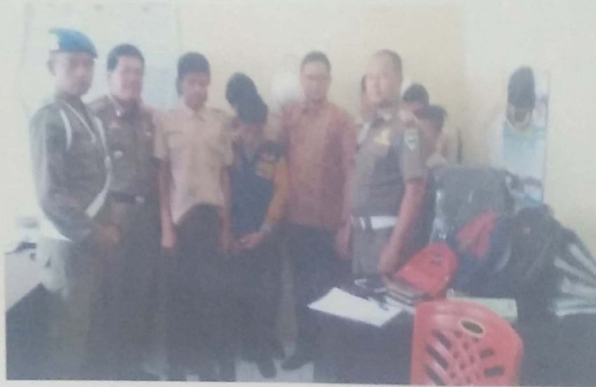
ANAK SEKOLAH MENGHISAP LEM