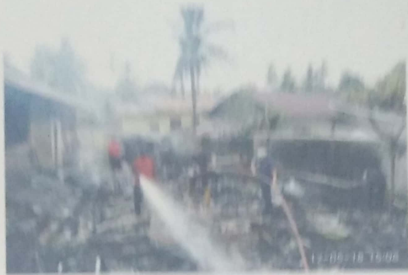
DOKUMENTASI KEBAKARAN RUMAH