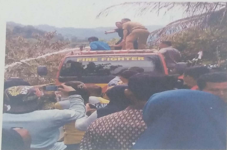
DOKUMENTASI KEBAKARAN LAHAN